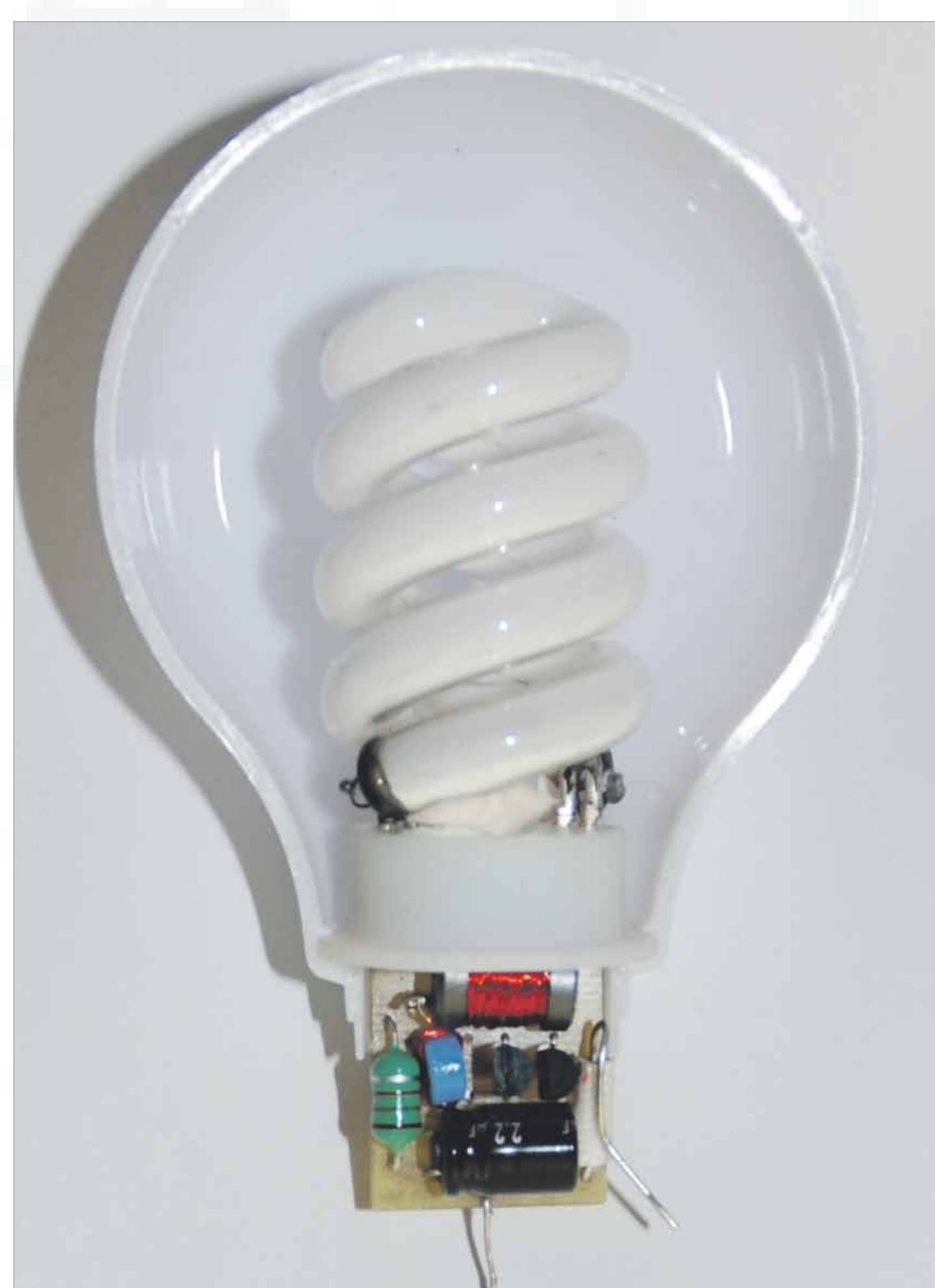
10W weiss CFL classic Spritzwassergeschützt IP54