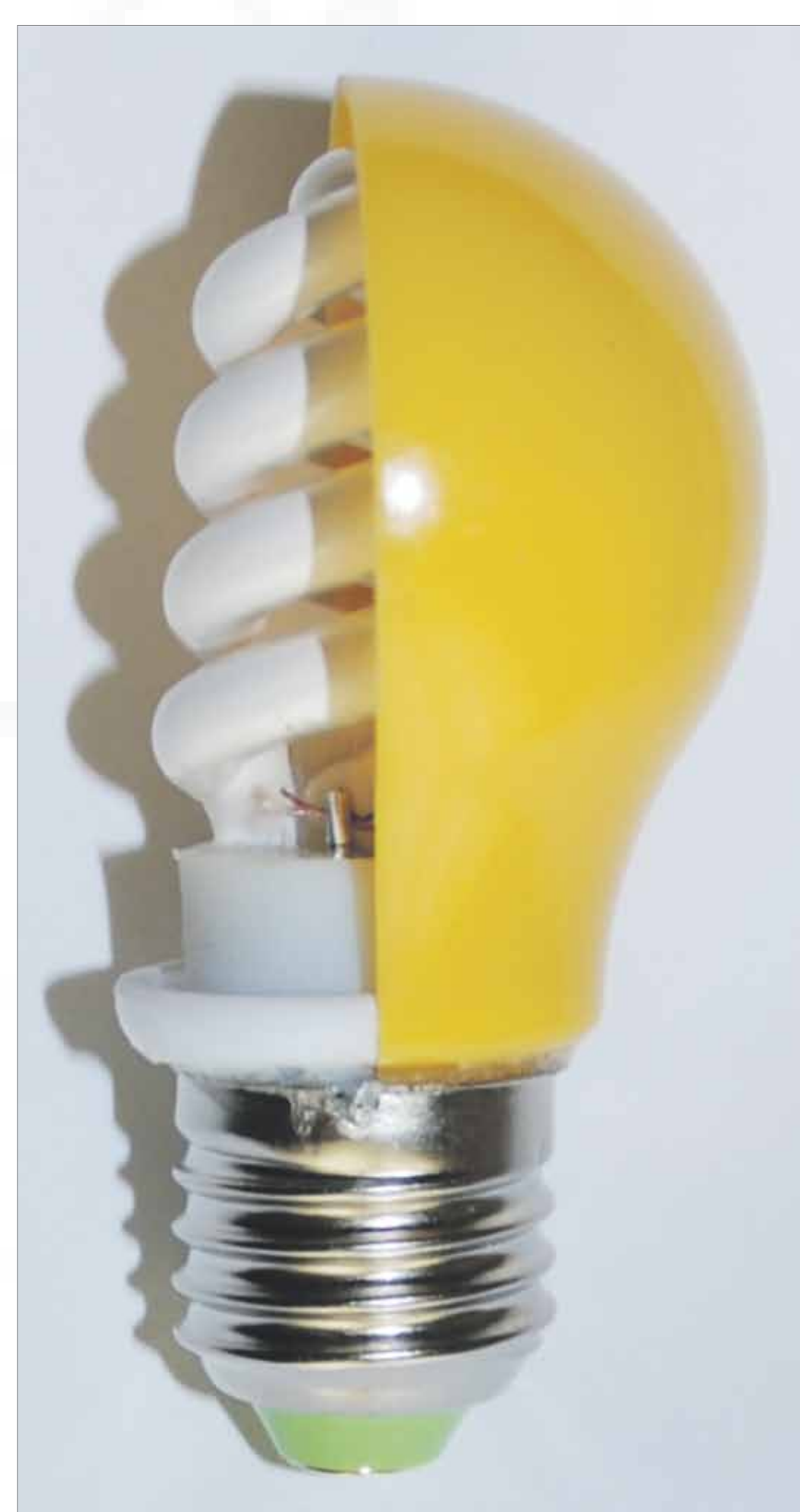
7W farbig CFL classic Spritzwassergeschützt IP54